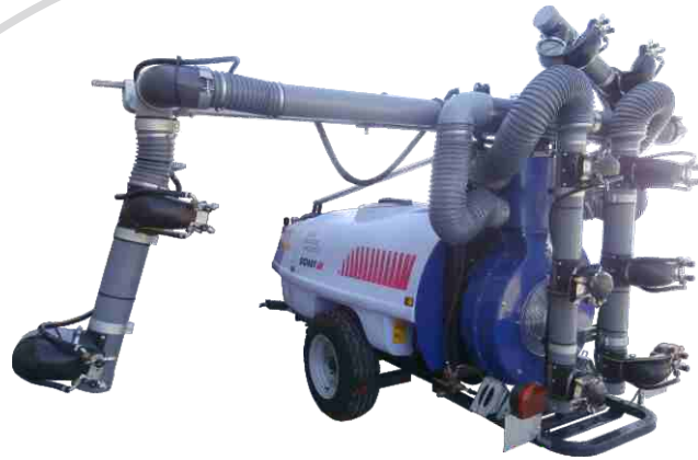
Mod. Multitub Retráctil