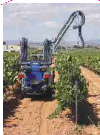
Detalle salvar hilera