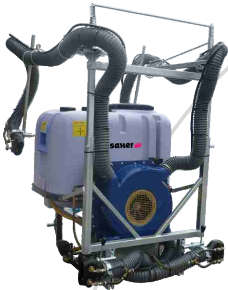
Mod. 4 salidas