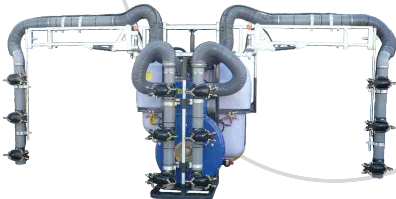
Mod. Multitub Evolución Plus