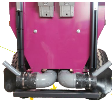
Detalle opcional salidas inferiores