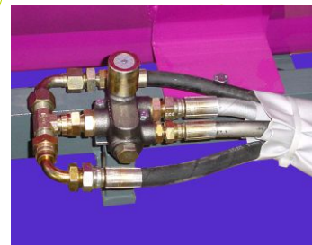
Mando hidráulico al tractor